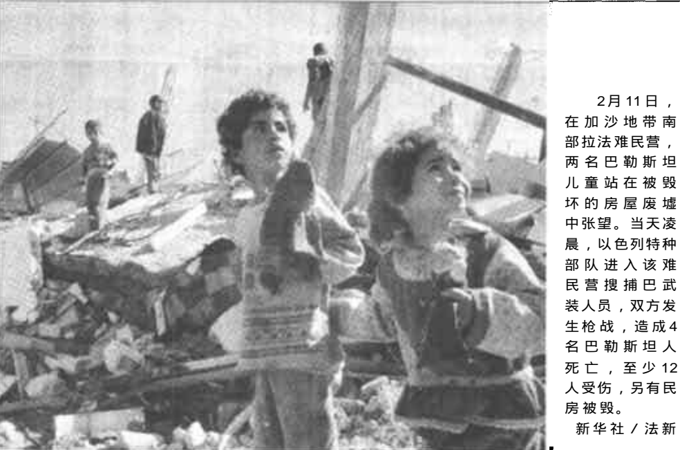
2月11日,在加沙地带南部拉法难民营,两名巴勒斯坦儿童站在被毁坏的房屋废墟中张望。当天凌晨,以色列特种部队进入该难民营搜捕巴勒斯坦武装人员,双方发生枪战,造成4名巴勒斯坦人死亡,至少12人受伤,另有民房被毁。

截至目前,我市新型农村合作医疗制度运行良好,全市共筹集新型农村合作医疗资金3229.2万元,农民人均32元,覆盖率达到98%。已补偿家庭账户资金666.1万元,统筹账户资金269.9万元,有效地提高了农民健康保障水平,防止了群众因病致贫、因病返贫的问题。