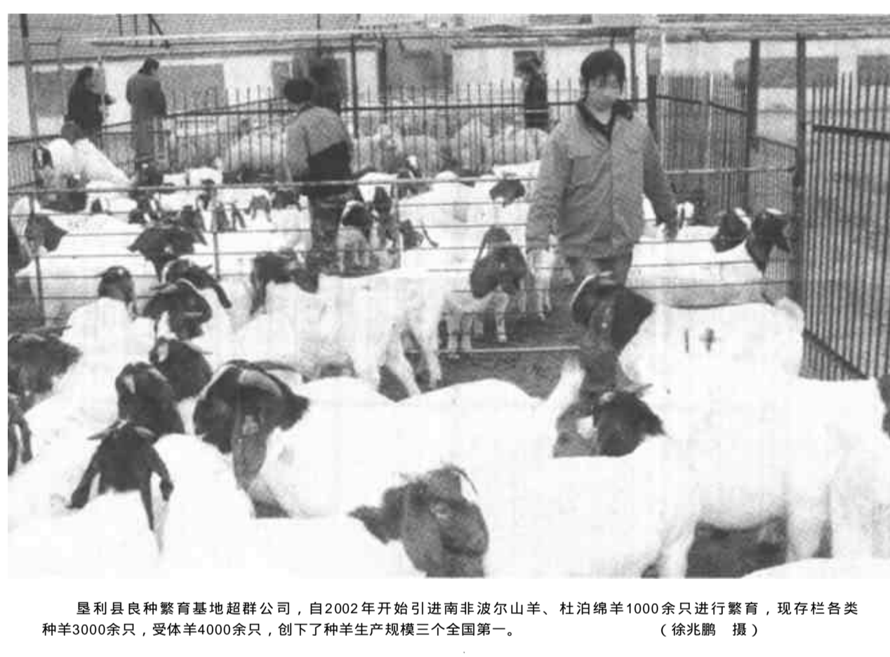
垦利县良种繁育基地超群公司，自2002年开始引进南非波尔山羊、杜泊绵羊1000余只进行繁育，现存栏各类种羊3000余只，受体羊4000余只，创下了种羊生产规模三个全国第一。（徐兆鹏 摄）

据了解，河口区实施“科技兴枣”战略，成立了“冬枣科技研究所”和拥有389个枣品种的试验园，并大力推行冬枣标准化生产，目前，国家级绿色冬枣示范基地已达到5万亩，该基地生产的冬枣全部达到了AA级绿色食品标准。（王志峰）